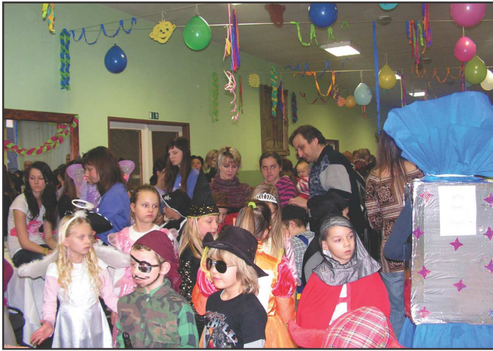
z karnevalovej diskotéky