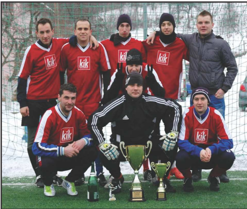
FCB WINNERS Omšenie - víťaz 3.ročníka zimnej Miniligy o putovný Pohár predsedu TJ Žihlavník

Rok 2013 sa z pohľadu našej TJ začal - tak ako vlni - ďalším, v poradí 3.ročníkom omšenskej zimnej miniligy. Turnaja sa zúčastnilo 7 mužstiev, z toho 5 z Omšenia a po jednom z Dolnej Poruby a z Trenčianskych Teplíc. Prvenstvo si tento krát nenechali ujsť chlapi FCB WINNERS Omšenie, ktorí - až na jedno zakopnutie - vcelku s prehľadom a zaslúžene zdvihli nad hlavu putovný Pohár predsedu TJ Žihlavník.