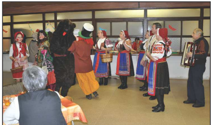
fašiangové vystúpenie Folklornej skupiny Dolina