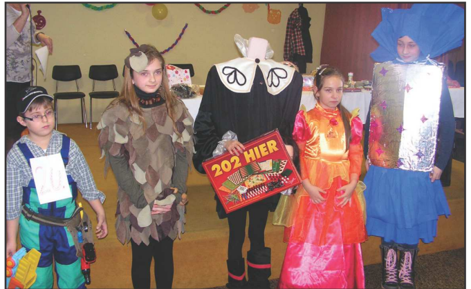
5 najkrajších masiek